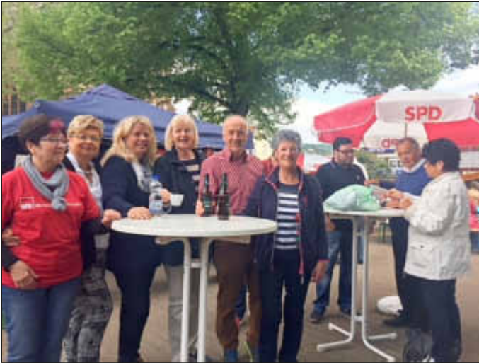
Viel Spaß beim Frühjahrsmarkt hatten die Vertreterinnen und Vertreter der SPD

Insbesondere die innovativen Spielelemente für Kinder, die großzügige Verbindung vom Marktplatz zum REWE- Markt sowie die parkähnliche barrierefreie Grünanlage mit hoher Aufenthaltsqualität überzeugen und bestätigen uns, dass die Entscheidung von Verwaltung und Gemeinderates im Jahre