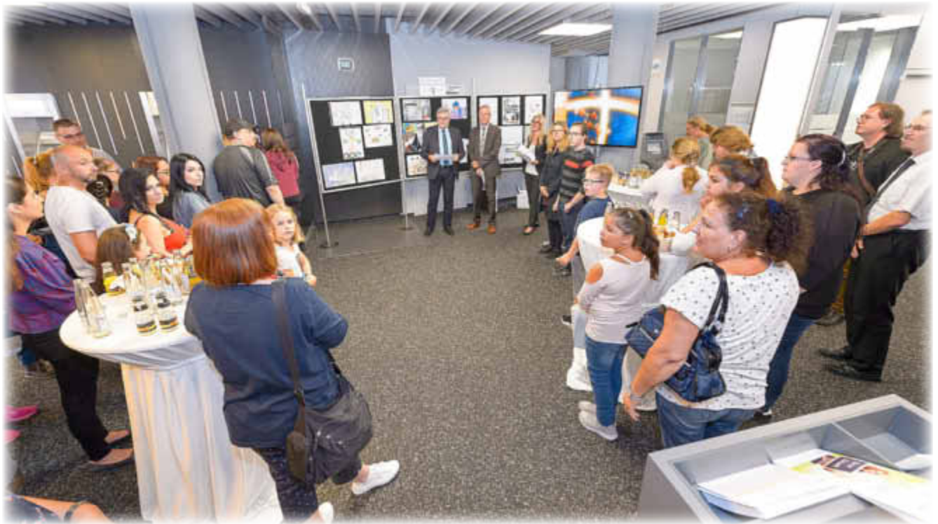
Preisverleihung „jugend creativ“ in der Schalterhalle der VVB in Sulzbach

Beim 48. Internationalen Jugendwettbewerb „jugend creativ“ der Volksbanken stehen die diesjährigen Gewinner auf Orts- und Landesebene fest. Das Thema „Erfindungen verändern unser Leben“ bot den jungen Künstlern viele Möglichkeiten. Sie haben ihre kreativen Erlebnisse auf wunderschön gemalten Bildern festgehalten und beeindruckten die Jury durch ihre fantasievolle Umsetzung des Themas.