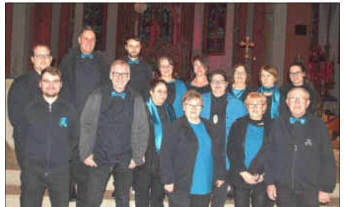
Das Orchester beim vorweihnachtlichen Konzert 2018