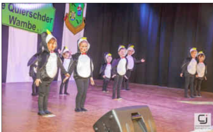
Die Mini Hüpfen als Pinguine Session 2018/2019

Minigarde (König der Löwen), Juniorengarde (Zaubershow) und Funkengarde (Der Grinch), sowie unser Kindermariechen bei den Freunden der Ki-Ka-Ju Merchweiler am Garde-Tanztreff teilgenommen. Dies ist ein Festival ohne jegliche Wertung, an dem Vereine des Regionalbezirks Illtal teilnehmen dürfen. In diesem Rahmen haben Tänzerinnen und Tänzer aller Altersklassen die Möglichkeit auch nach Fasching nochmal ihren Tanz zu präsentieren und auch mal über den Tellerrand zu schauen und andere Vereine und ihre Tänze zu sehen. Wir danken unseren Garden und