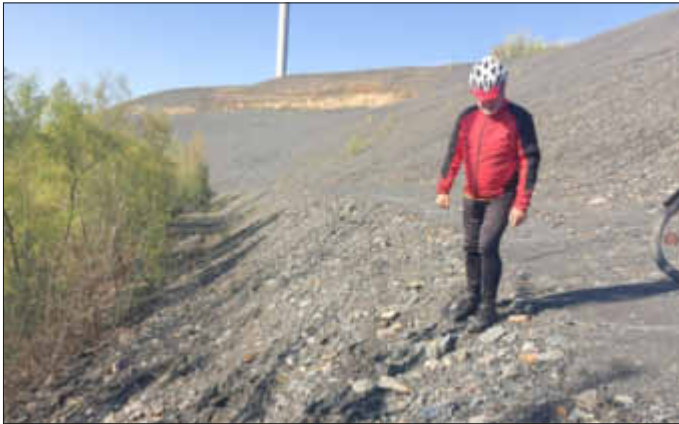
gefährlicher Radweg auf der Bergehalde

machten unsere beiden Radfahrer am Talrandweg hinter der Sulzbach Straße aus. Hier ist der asphaltierte Belag durch Wurzeln sehr stark aufgebrochen und in einem unzumutbaren Zustand, der auch sehr gefährlich werden kann.