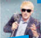
Deutsche Schlagernacht mit Heino

Feiern, tanzen & singen Sie mit Ihren Lieblingskünstlern!