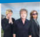
Konzert von Fools Garden

»Nacht des Deutschen Schlagers« am 25.4.2020