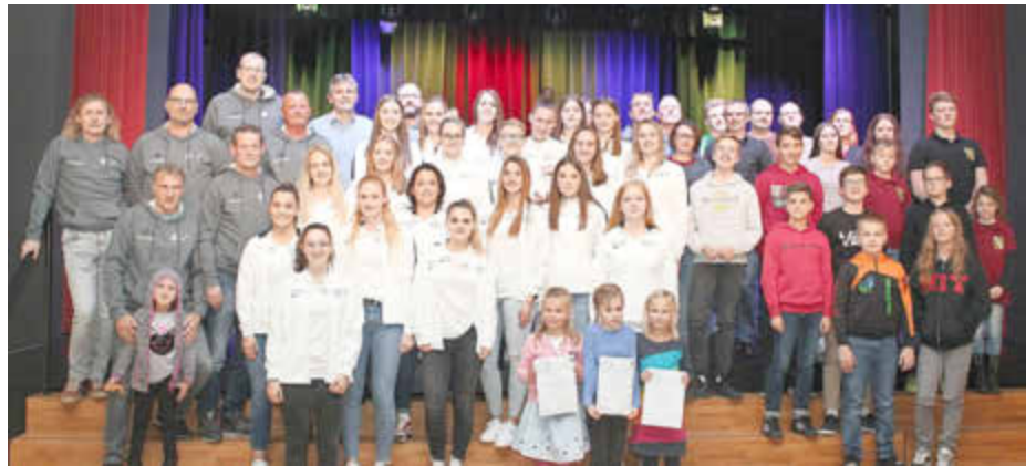
Die geehrten Mannschaften aus der Gemeinde Quierschied.

Weil die ehrenamtliche Arbeit der Trainerinnen und Trainer sowie der Vorstandsmitglieder in den Vereinen mit den Leistungen ihrer Schützlinge und Mitglieder untrennbar verbunden ist, gilt die Auszeichnung durch die Gemeinde auch als eine Auszeichnung für alle Verantwortlichen „hinter den Kulissen“. Ihnen sprach Bürgermeister seinen herzlichen Dank für ihr großes gesellschaftliches Engagement aus. „Wir möchten mit dieser Veranstaltung die Verbundenheit der Gemeinde mit dem Sport zum Ausdruck bringen.