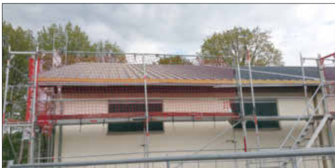
Dacharbeiten an der Schulturnhalle Fischbach