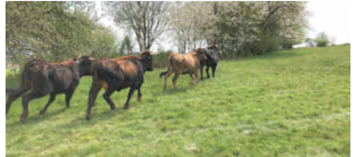
Endlich am Schlammweiher Hahnwies!

Naturerlebnisgebiet am Schlammweiher Hahnwies am Start Seit Donnerstag letzter Woche ist das Naturerlebnisgebiet im Landschaftslabor „Vogelzug und wilde Weiden“ am Schlammweiher Hahnwies um eine erste Attraktion reicher: 13 Taurus- Rinder mit 5 Kälbern haben den ersten Abschnitt des geplanten Beweidungsprojektes unter ihre Hufe genommen. In wenigen Wochen sollen noch „Exmoor- Ponys“ folgen.