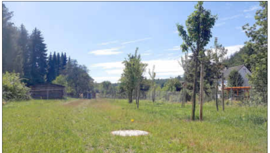
Neuer Kanal und neue Bepflanzung Im Rod in Fischbach-Camphausen.

veranschlagt. Die Schlussrechnung steht noch aus. Unterhalb der Straße Im Rod wurde entlang des Fischbachs ein neuer Kanal verlegt, durch den nun alle Anwohnerinnen und Anwohner an das öffentliche Abwassersystem angeschlossen sind. Der neue Kanal verhindert zudem, dass Abwässer in den Fischbach gelangen. Zusätzlich wurden in diesem Bereich entlang des Fischbachs landschaftspflegerische Maßnahmen durchgeführt, in deren Rahmen Ersatzpflanzungen vorgenommen und ein Wildzaun errichtet wurde.