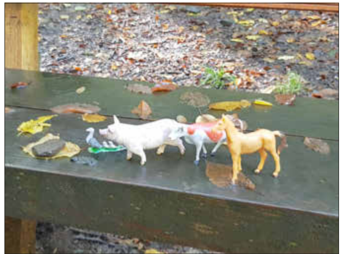
„Hans im Glück“

Allen hat der Nachmittag viel Spaß gemacht, zumal dies die erste kfd-Aktion nach den Einschränkungen durch die Corona-Pandemie war. Wir hoffen, mit solchen Angeboten weiter machen zu können.