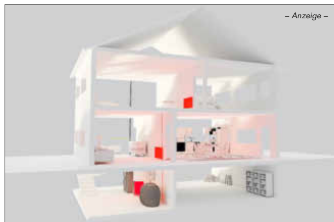
- Anzeige -