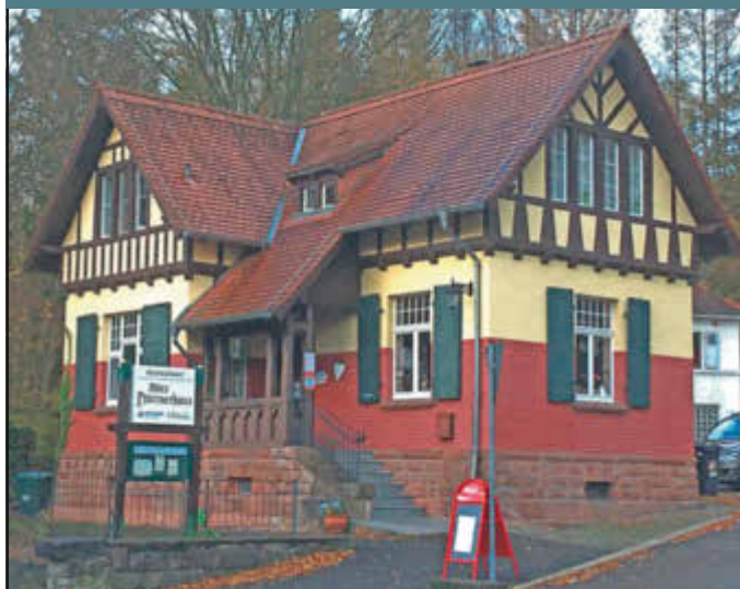
tand des Judo-Club Quierschied e.V. ganz herzlich gratuliert!