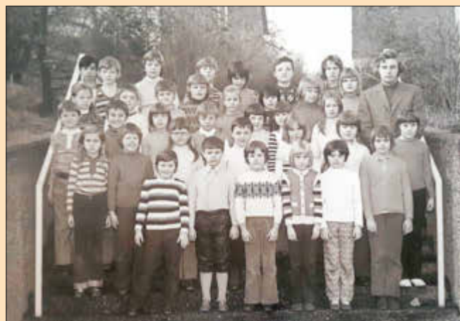
Die 4. Klasse der Grundschule Lasbach im Jahr 1973.