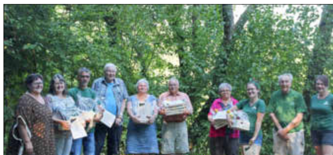
Wir ehren langjährige Vereinsmitglieder

Normalerweise finden die Ehrungen verdienter Vereinsmitglieder im Rahmen der jährlichen Weihnachtsfeier statt. Aufgrund der aktuellen Situation ehrten wir folgende Mitglieder mit einem Präsent und einer Urkunde für ihre langjährige Mitgliedschaft im Rahmen der Jahreshauptversammlung: