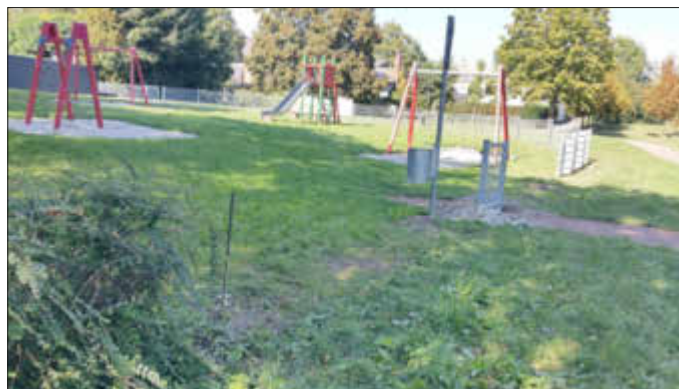
Spielplatz Waldparkanlage Fischbach