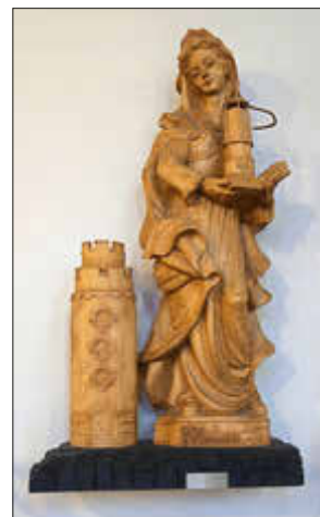
Heilige Sankt Barbara