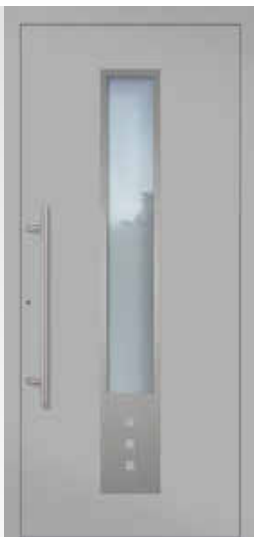
A 4 U d -Wert 0,80 W/(m 2 K)* Farbe Weißaluminium FS