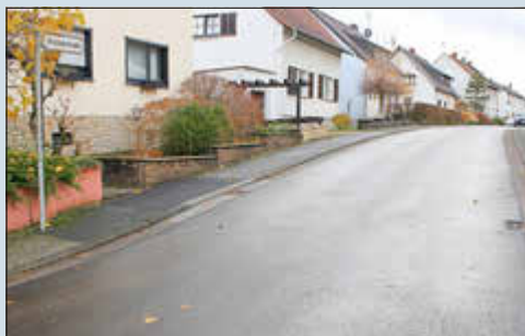
Die Brucknerstraße in Quierschied.