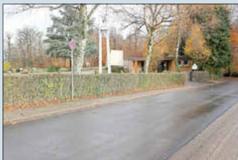
Der Eingangsbereich zum Friedhof Göttelborn.