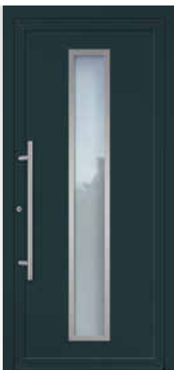
KOMPAKT 1 U d -Wert 1,23 W/(m 2 K)* Farbe Anthrazitgrau FS