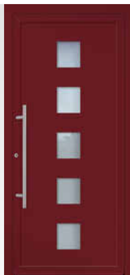
KOMPAKT 10 U d -Wert 1,23 W/(m 2 K)* Farbe Weinrot FS