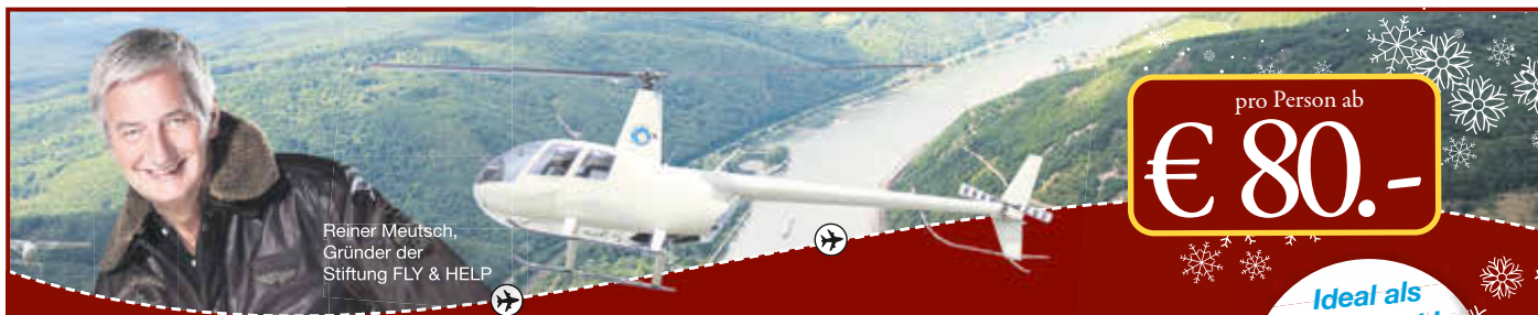
Reiner Meutsch, Gründer der Stiftung FLY & HELP