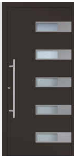
A 12335 U d -Wert 0,82 W/(m 2 K)* Farbe Braun FS