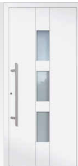
A 12422 1) U d -Wert 0,80 W/(m 2 K)* Farbe Verkehrsweiß FS