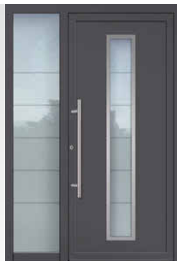
KOMPAKT 16 mit Seitenteil U d -Wert 1,23 W/(m 2 K)* Farbe Eisen glimmer FS